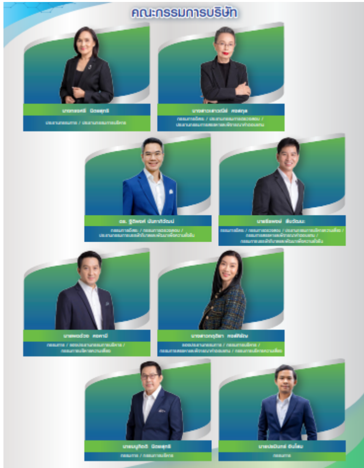
คณะกรรมการบริษัท